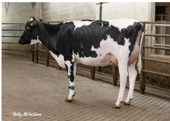
WESTCOAST MLIRE FAR8391 11926 DAUGHTER